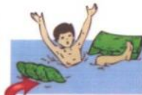
Далеко отплывать от берега на надувных матрацах и кругах