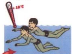
Купаться в воде при температуре ниже 18°C