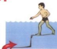
Купаться в неустановленных местах