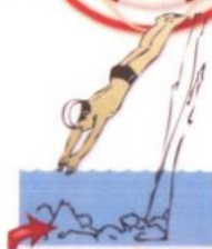
Прыгать с обрывов и вышек, не проверив дно