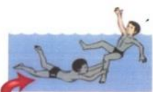
Устраивать на воде опасные игры