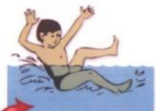
Подавать ложные сигналы тревоги