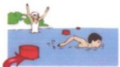
Заплывать за буйки или пытаться переплыть водоемы